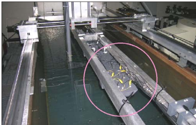
Les installations d'essai physique du DL(A) pour les études de protection cathodique. Le modèle d'une coque de navire est encerclé.