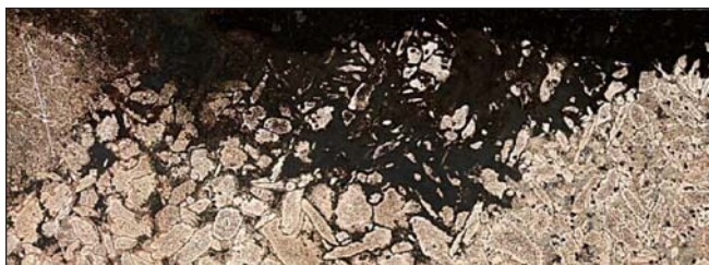
Image microscopique de la corrosion sélective de phase du bronze aluminium-nickel dans une soudure.

La maintenance des navires, des aéronefs et des véhicules militaires en vue d'en assurer la disponibilité opérationnelle est une des activités essentielles des Forces canadiennes (FC). La fiabilité et le rendement du matériel dépendent largement des matériaux et des procédés utilisés :