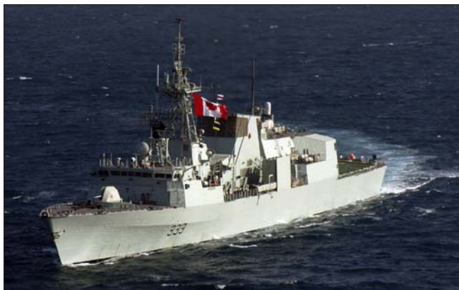
L'expertise de recherche sur les matériaux facilite la maintenance et la prévention des défaillances à bord des navires de guerre des FC.